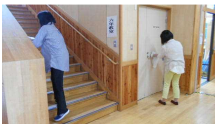
くもちっこ応援団の方による

新型コロナに負けないよう、うがい手洗い等に気をつけて、みんなでなかよく学校生活を送りましょう。