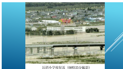
長沼小学校付近（08時25分撮影）

みなさんこんにちは。校長先生の自己紹介をします。私は、この望月小学校に来る前は、長野市の長沼小学校で校長先生をしていました。リンゴ畑の中にあるのどかな小学校でしたが、5年前の台風で、千曲川の堤防が決壊してリンゴ畑が水に浸かってしまいました。校舎も1階が水に浸かり、勉強するところがなくなってしまいました。